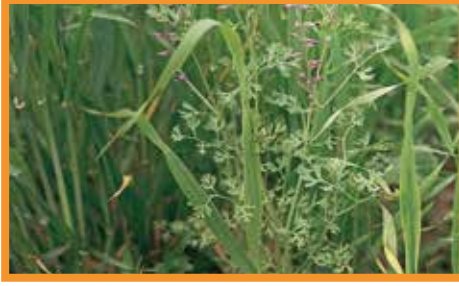
Hakiki Şahtere ( Fumaria officinalis )