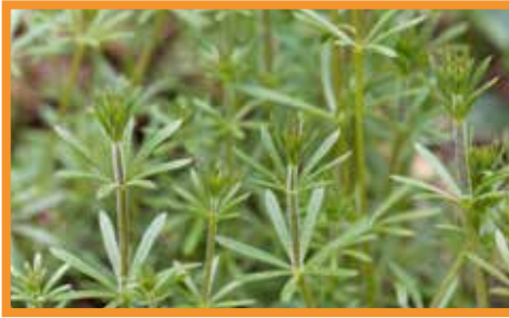
Dil kanatan ( Galium aparine )