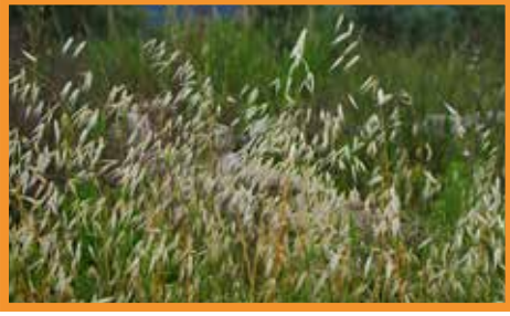
Kısır Yabani Yulaf ( Avena sterilis )