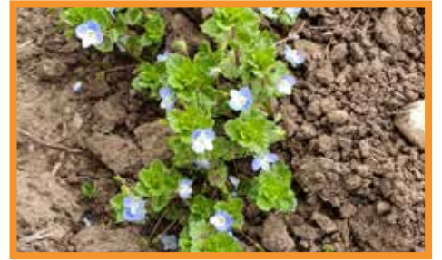
Yavşan otu ( Veronica hederifolia )