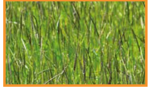
Tilki Kuyruđu ( Alopecurus myosuroides )