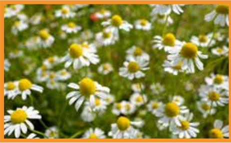
Hakiki papatya ( Matricaria chamomilla )