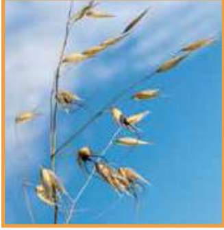
Kısır Yabancı Yulaf ( Avena sterilis )