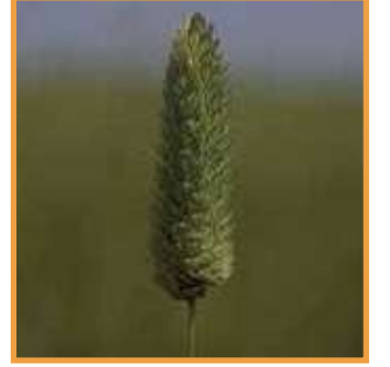
Kuş Otu ( Phalaris brachystachys )