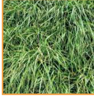
İtalyan Çimi ( Lolium multiflorum )