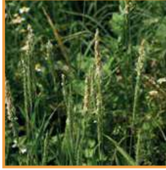
Tilki Kuyruğu ( Alopecurus myosuroides )