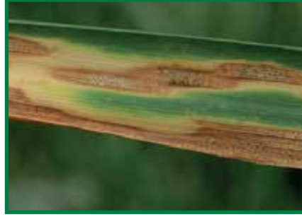
Septorya Yaprak Leke Hastalığı ( Septoria tritici )