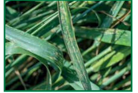
Tahıl Külleme ( Erysiphegraminis f. sp. tritici )