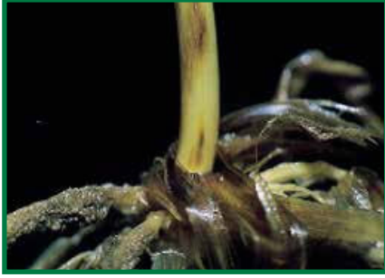
Kök ve Kök Boğazı Çürüklüğü ( Fusarium spp. , Rhizoctonia spp. )