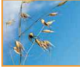
Kısır Yabani Yulaf ( Avena sterilis )