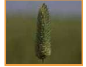
Kuş Otu ( Phalaris brachystachys )