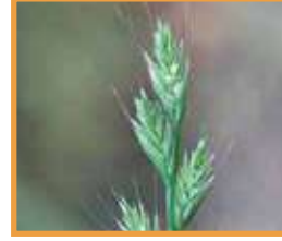
İtalyan Çimi ( Lolium multiflorum )