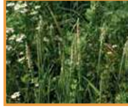
Tilki Kuyruğu ( Alopecurus myosuroides )