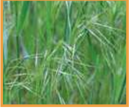
Püsküllü Çayır ( Bromus tectorum )