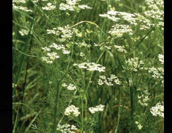
Kokarot ( Bifora radians )