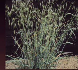
Yabancı yulaf ( Avena sterilis )