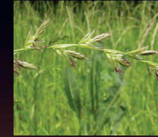
Delice ( Lolium temulentum )