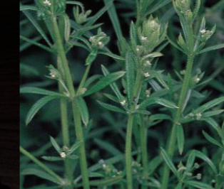
Dilkanatan ( Galium aparine )