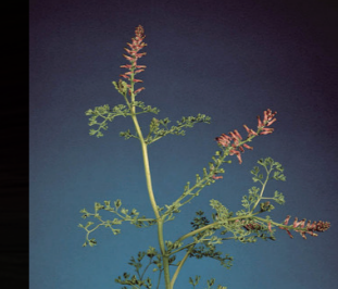
Şahtere ( Fumaria officinalis )