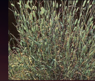
Kuş otu ( Phalaris brachystachys )