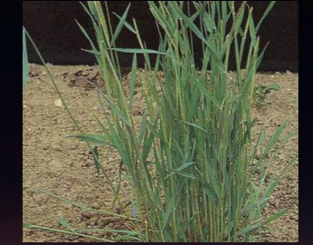
Tilki kuyruğu ( Alopecurus myosuroides )