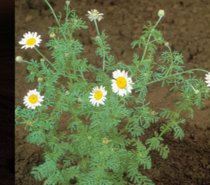
T.köpek papatyası ( Anthemis arvensis )